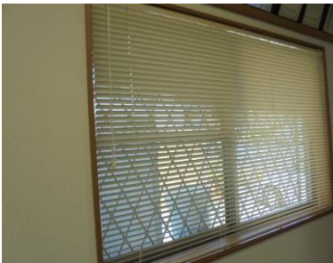
ブラインドの導入